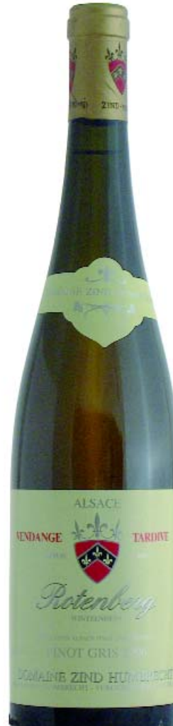
Alsace Pinot Gris Rotenberg Vendange Tardive 1996 DOMAINE ZIND HUMBRECHT