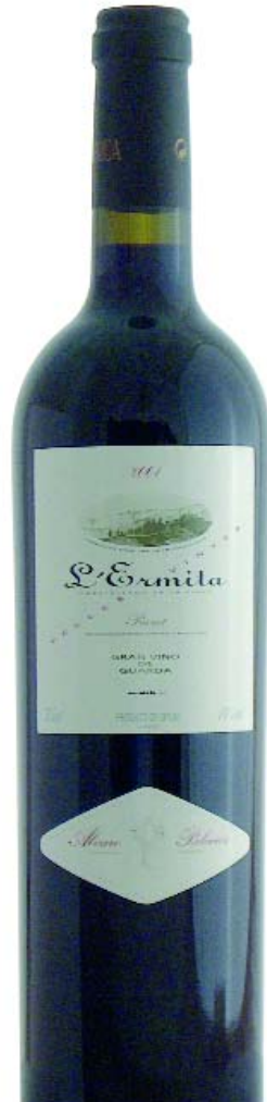
Priorat L'Ermita Velles Vinyes 2001 ALVARO PALACIOS