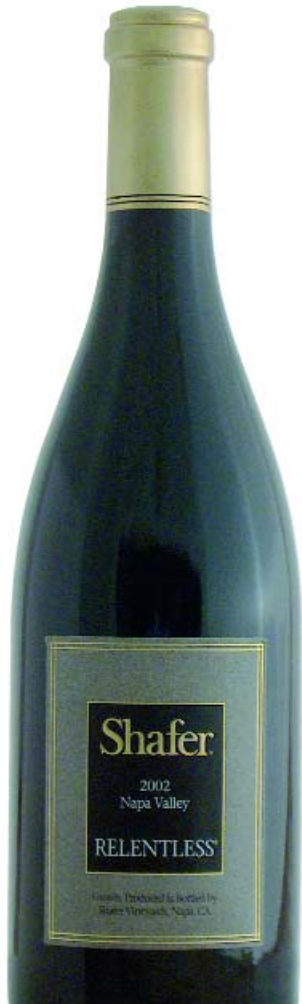
Napa Valley Syrah Relentless 2002 SHAFFER