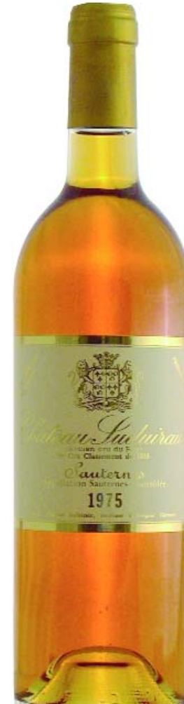
Sauternes 1975 Ancien Cru du Roy CHÂTEAU SUDUIRAUT